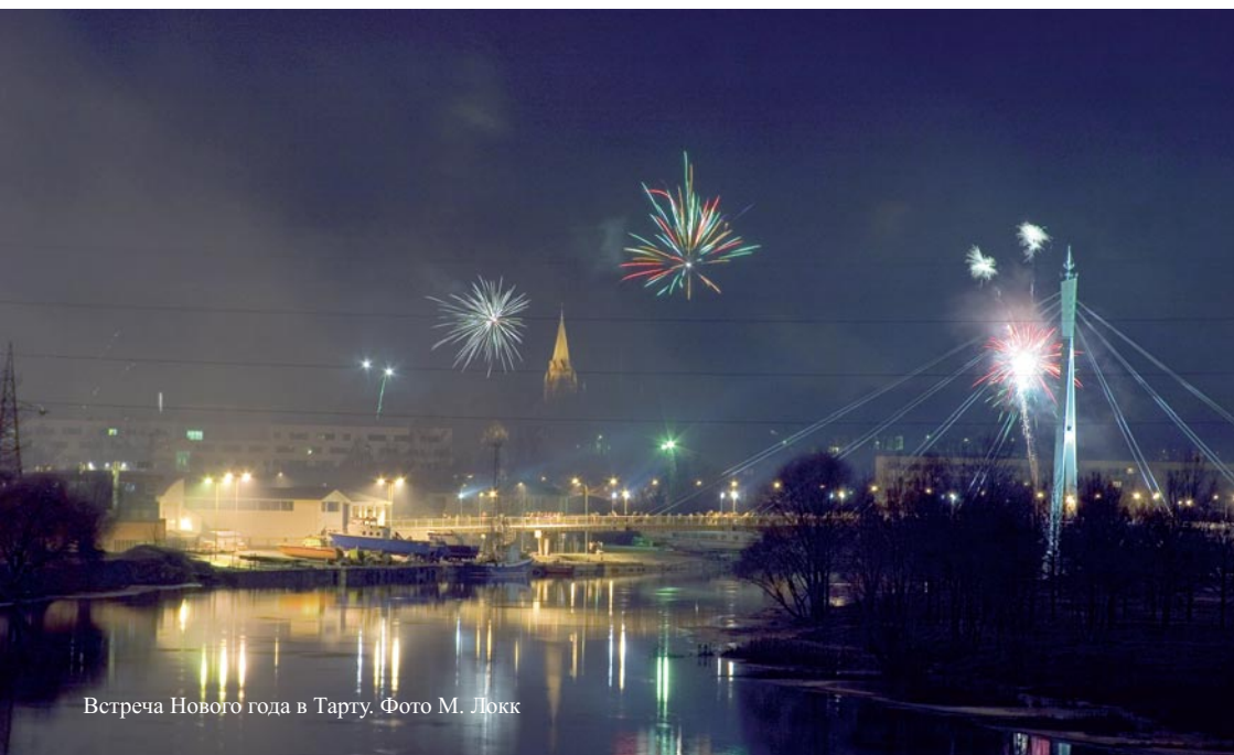
Встреча Нового года в Тарту.