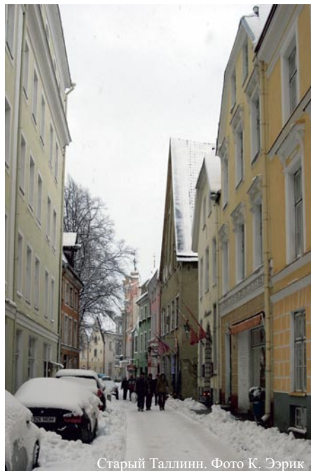
Старый Таллинн.

Мы приготовили для вас календарь главных событий культурной программы Таллинн-2011.