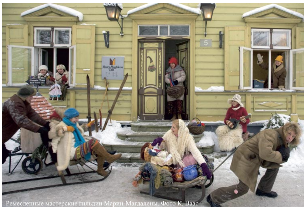
Ремесленные мастерские гильдии Мари-Магдалены.