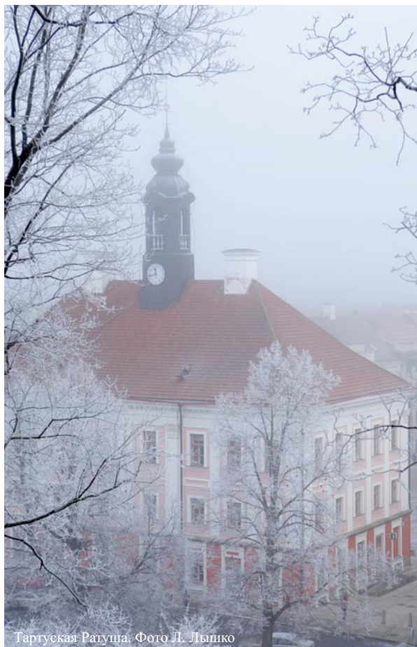
Тартуская Ратуша.