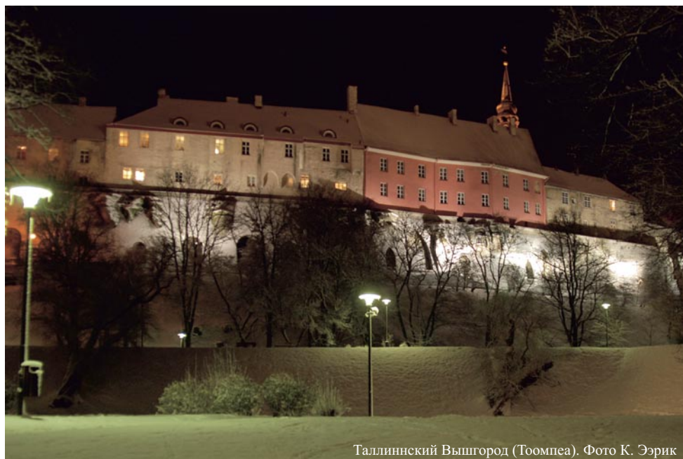
Таллиннский Вышгород (Тоомпеа).