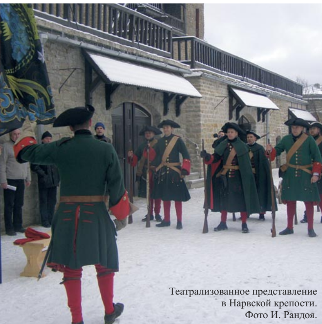
Театрализованное представление в Нарвской крепости.

терная акустика. Помимо богослужений, здесь проходят концерты и другие культурные мероприятия.