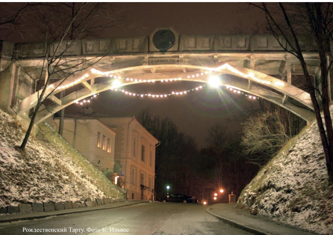
Рождественский Тарту.